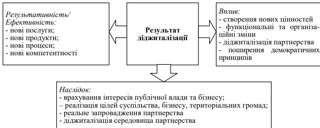
Рис. 2. Діджиталізації у партнерських відносинах публічної влади і бізнесу